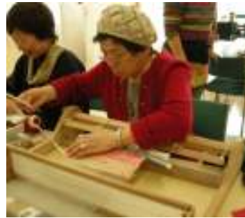
裂き織り体験コーナー