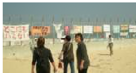
全国から集まった反対運動の垂れ幕

今もなお、戦い続けている普天間や辺野古の基地問題をこの目で見る事ができ、基地の中にある沖縄を